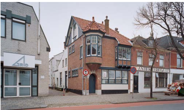
Hoekhuis, Rijnstraat 58A, in Katwijk aan den Rijn. G.J. Dukker 2003